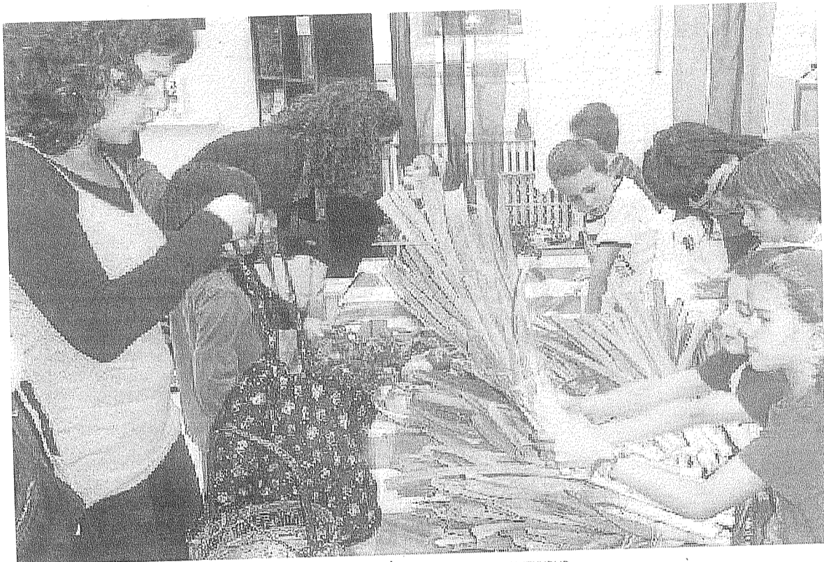
Barazki-dendan baratzean ekoiztutakoa saltzen dugu.

Egitear dugu laugarren denda; honetan, baratzuri freskoak eta